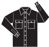
VÊTEMENTS DE PROTECTION