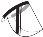
ÉQUIPEMENT DE PROTECTION DU VISAGE